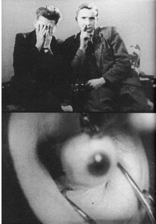
aus : Gustav Deutsch : Film ist.I , Details,