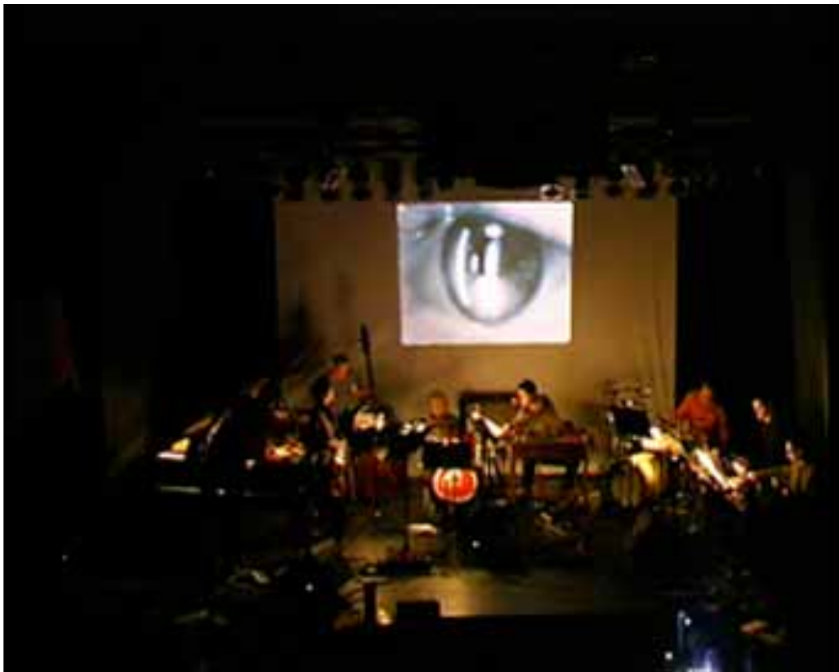
HL & Velvet Lounge@Porgy&Bess, UA. Film ist.Musik, 2001